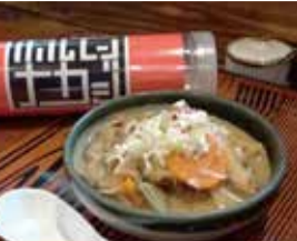
もつ煮込み ホルモンナカジ自慢の味 400g 700円 ※ネギは付いてません