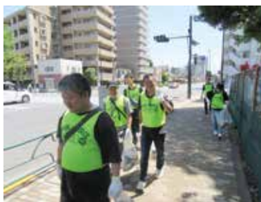
清洲橋通りの歩道を清掃中の江東東税務署の皆様

当日は、法人会会員は勿論江東東税務署、江東都税事務所、城東警察署および大同生命保険(株)の方々、また松本寝