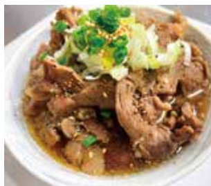
和牛スジ煮込み じっくり煮込んだ柔らかお肉 300g 1000円

ただ、食品専用という訳ではなく、一緒に飲料も並んでいる普通の販売機というところが面白い!!聞けば中地さん