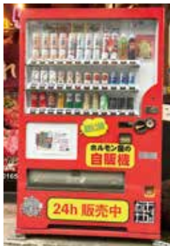
ホルモン屋の自販機→

販売機だが、よく見ると、缶ジュースが長くなったような筒が幾つも上段に並んでいる。筒の中央にホルモンナカジのロゴ、その上には「もつ煮込み」「激辛もつ煮込み」「カレーもつ煮込み」「和牛スジ煮込み」「牛タンひき肉入りカレー」など書かれてある。何とナカジ自慢の一品を販売機でも購入できるようだ。横の説明書きには、筒の中に真空パックした料理が入っていること。パックを取り出した後の筒は販売機横のBOXに戻すこと。中のパックは封を切らずに湯煎で温めてお召し上がりくださいとなっている。