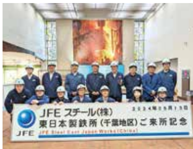
青年部会参加者の皆さんヘルメットが似合ってます

鋼の炉や、溶けた鋼が連続的に厚みのある鋼片に固められて板状に流れていく大迫力の行程を見学させて頂いた。持続可能でクリーンな製鉄所を目指すJFEスチール株式会社並びに、お世話になった担当者様に貴重な見学をさせて頂きお礼申し上げます。