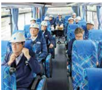
製鉄所内見学のためヘルメットとゴーグルで準備中!

鋼の炉や、溶けた鋼が連続的に厚みのある鋼片に固められて板状に流れていく大迫力の行程を見学させて頂いた。持続可能でクリーンな製鉄所を目指すJFEスチール株式会社並びに、お世話になった担当者様に貴重な見学をさせて頂きお礼申し上げます。