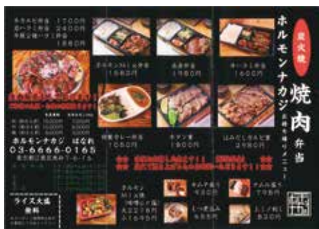
炭火焼 焼肉弁当のメニュー

住所: 南砂7-1-16 電話: 6666-0165 時間: 24時間 定休日: なし。売切れあり。