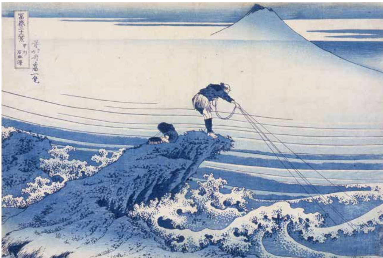
す み だ 北 斎 美 術 館 蔵