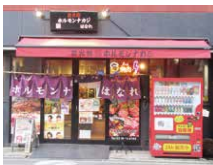
炭火焼ホルモンナカジはなれの入口