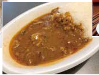
カレーもつ煮込み 400g 800円 ※ライスは付いてません