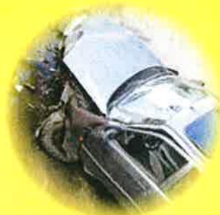
営業車が近隣の人と事故、 相手方が死亡してしまった…