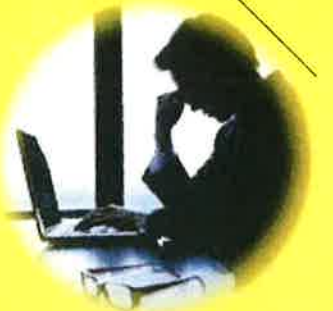
過労死の労災事故で 高額賠償が…