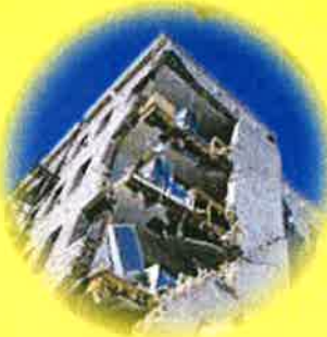
地震・津波で建物が倒壊、 損害を受けた…

専門のコンサルタントが 隠れたリスク を “見える化” し、 貴社に適したリスク対策をご提供いたします。