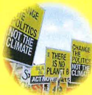
海外子会社が現地の暴動により 社屋が損壊した…