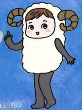
イラスト | 細川貂々