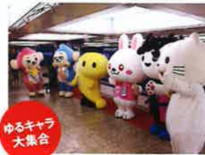
ゆるキャラ大集合

昨年、大好評だったドゥーストリオによる生演奏ステージや各種クイズ大会、輪投げ、ガラポン、はかりチャレンジ、スタンプラリー、ゆるキャラ大集合など盛りだくさん。小さなお子様からお年寄りまで家族で楽しめるイベントです!!