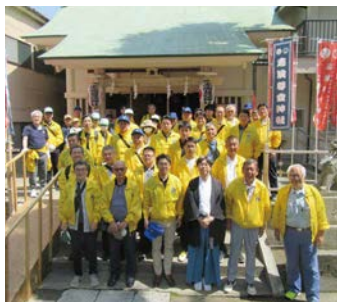
志演尊空神社境内の前で宮司様と一緒に集合写真

江東東税務署、江東都税事務所、城東警察署および大同生命保険(株)の方々など合わせて65名にご参加いただいた。境川交差点を中心に明治通り、清洲橋通り、砂町銀座商店街等の清掃を行い、ペットボトルや空き缶の他、落ち葉やビニール、タバコの吸い殻なども集まり45袋のゴミ袋で5袋のゴミが集められた。ご協力いただいた皆さんに第50回社会貢献活動を記念した参加賞をお配りして11時に終了した。次回は10月に亀戸地区で実施予定。皆様のご参加をお待ちしております。