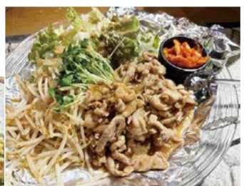
国産豚肉 200gと野菜のボリューム!! スタミナバッチリ「焼肉サラダ」 1,280円

評判のランチは、日替りです。4から5種類のセットメニューがあり、ライス・サラダ・ミニパスタ・お新香・味噌汁が付く「ハンバーグステーキ」や「ポークアラビアータ」な