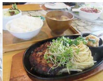
おろしポン酢でいただくジュシー「ハンバーグステーキ」のランチセット 1,100円

大好きな組み合わせの「もち明太子とチーズのオープン焼」パリパリ生地の「ゴルゴンゾーラピザ」150g以上の「黒毛和牛中落ち鉄板焼」などの他「照り焼きチキンステーキ」や、納豆やエビマヨ、ミートソースなど選べる具材の「オムレツ」など。