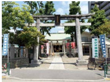
歴史ある志演尊空神社

志演尊空神社は元南葛飾郡深川の唐島(今の東扇橋町)に寛永元年(1624年)当地開発の際洲嶼の中に熊野権現として鎮座していましたが、菅原長寛(菅原道真公二十世の孫)が里民の要望により社稷安穩の為に稲荷大神を勧請し熊野・吉野両神を合わせて祀り深川稲荷と称し土地の産土神として崇敬を篤めました。