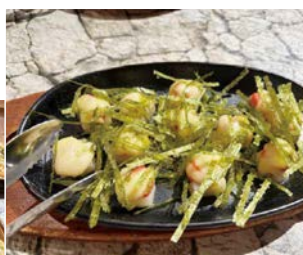
ひと口大の大きさが嬉しい！ アツアツの「もち明太子とチーズのオープン焼」 650円

ほとんどのお客様がオーダーするほど人気!! 「まぐろのカルパッチョ」 1,000円