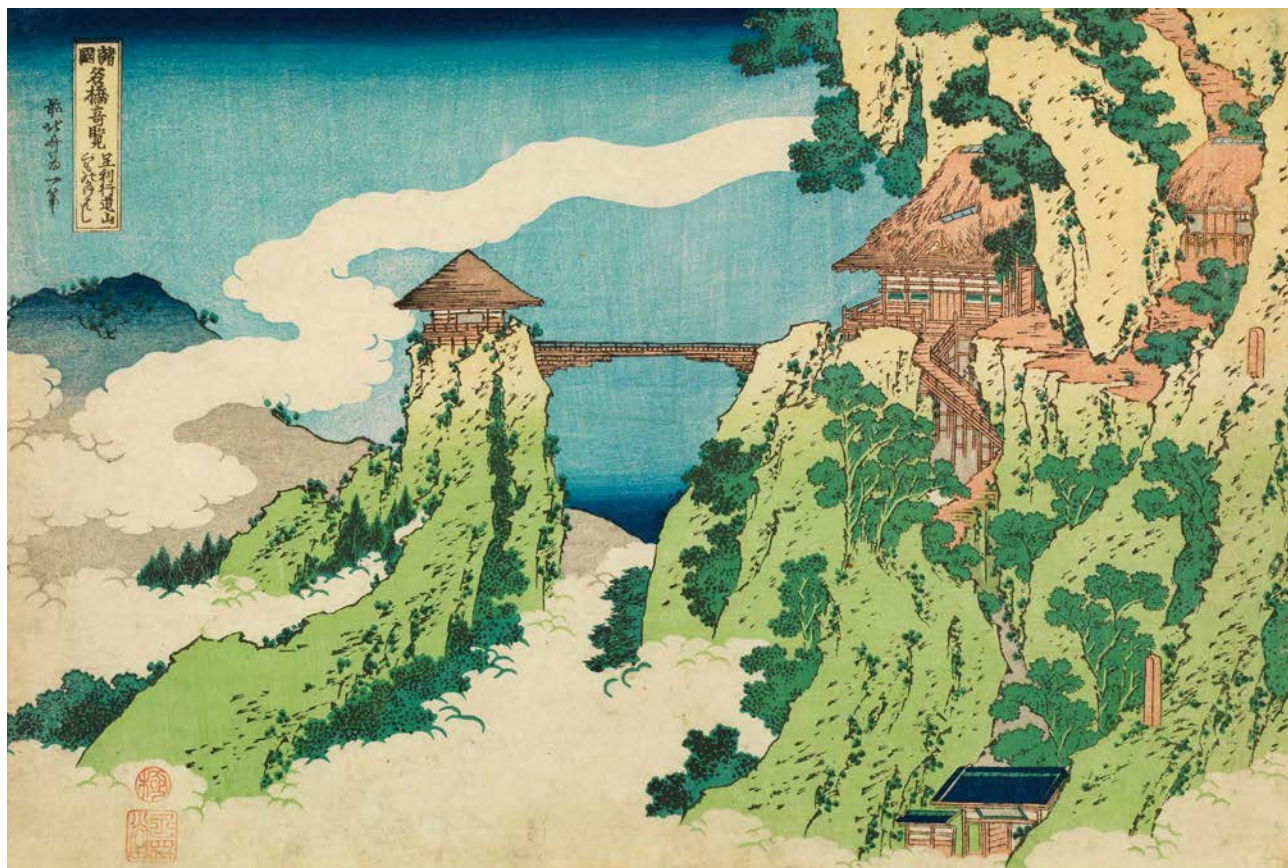
すみだ北齋美術館蔵