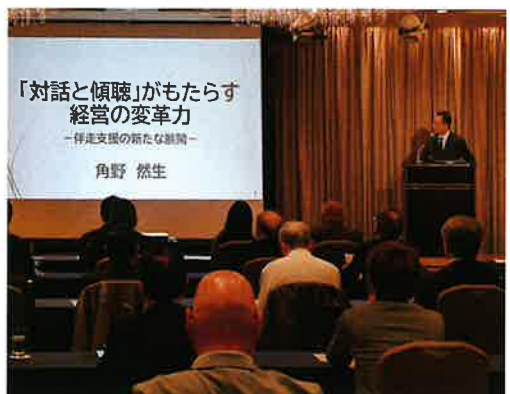
熱心に解説を聴く受講者