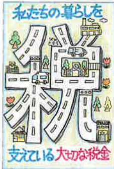
【練馬東法人会】 宮代 桃花さん(6年生)