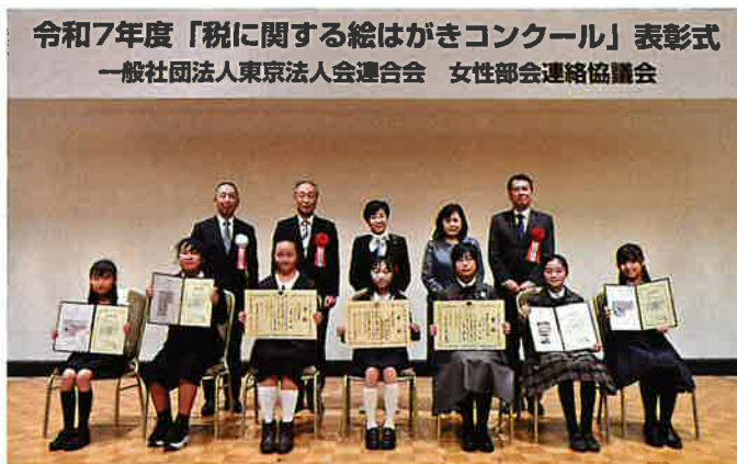
受賞者全員で記念撮影