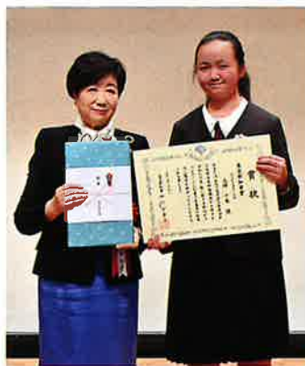
小池百合子東京都知事と都知事賞の大坪千隼さん(右)

の作品も税への理解を深め、真摯に表現に向き合った多様性に富む内容」と評価した。表彰式には小池百合子東京都知事も駆けつけ挨拶。各受賞者に表彰状と副賞が授与され、記念撮影を行った。会場入口には各会から推薦された作品全48点が掲示され、参加者の関心を集めた。