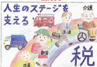
【荒川法人会】 村中 杏実さん(6年生)